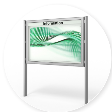
Optional: freistehende Variante auf Standbeinen